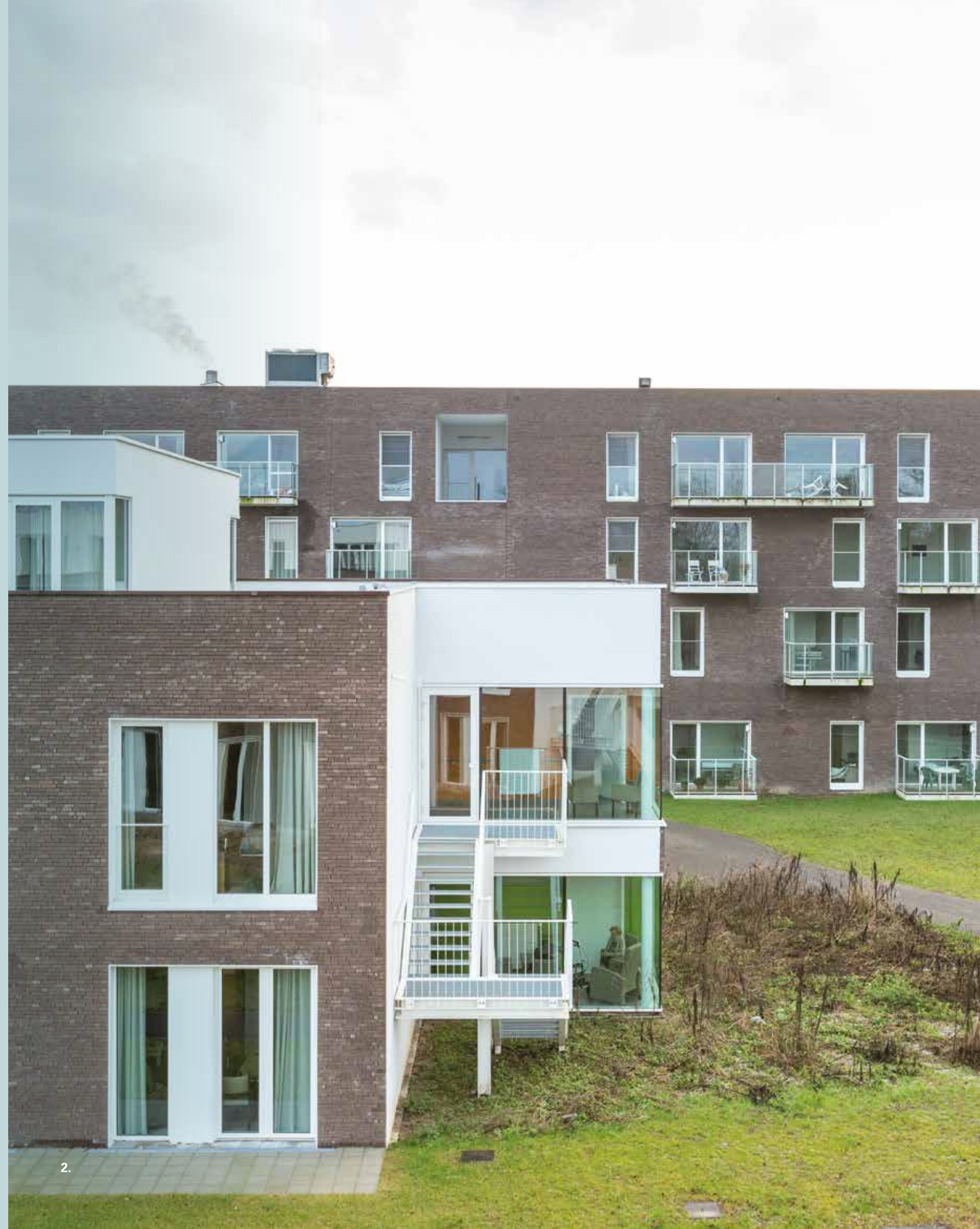
foto 2: Alle appartementen of kamers beschikken over een balkon of terras.

foto 1: De ramen komen tot op de grond om extra daglicht binnen te laten wat de bewoners een goed gevoel moet geven.